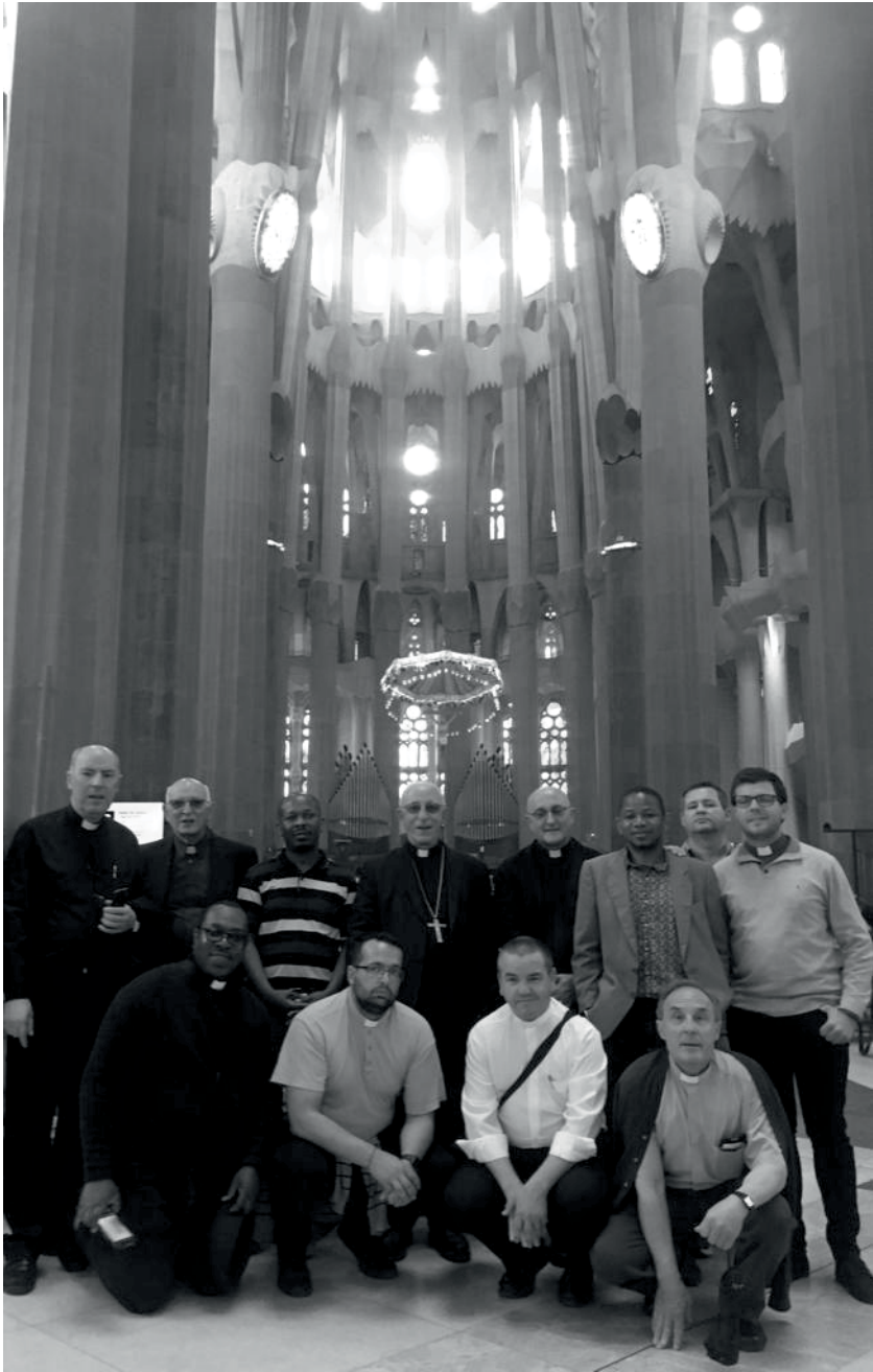
El Obispo con un grupo de sacerdotes diocesanos en peregrinación en Barcelona